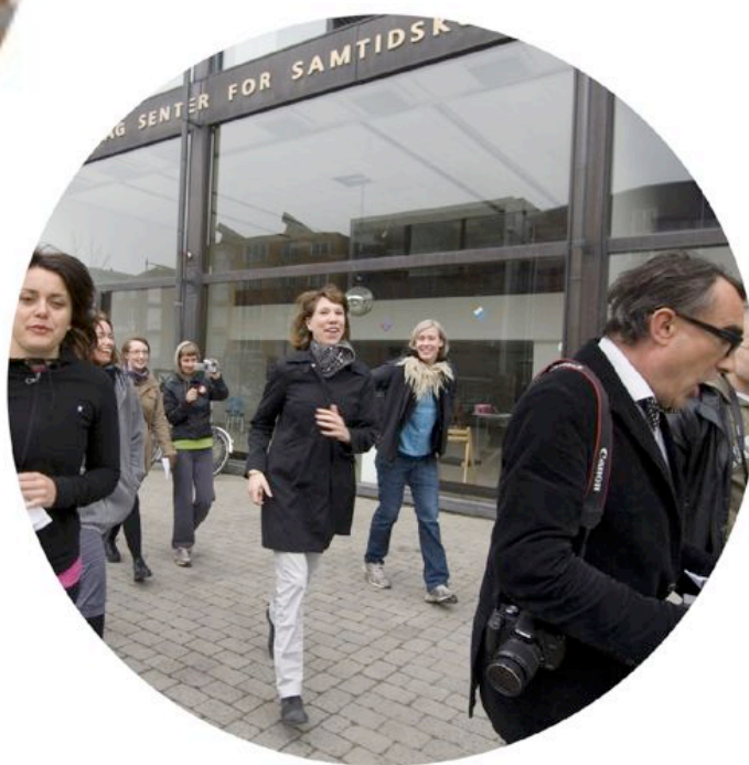
FOTO NO NEED FOR CONCERNE AV LISA STÅLSPETS , EVIL DEAD AV JAN HAKON ERIKSEN OG CRITICAL RUN(FOTOT BRYNHILD BYE)