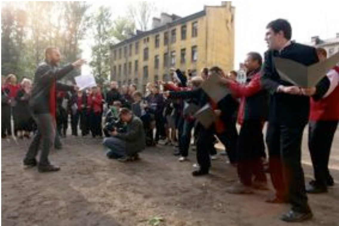
FOTO COMPLAINTS CHOIR ST.PETERSBURG, TELLERVO KALLEINEN & OLIVER KOCHTA KALLEINEN

Opprettholde rollen som kvalitetssikrer av det kunstfaglige innholdet innen DKS visuell kunst, i samarbeid med Sør Trøndelag fylkeskommune.