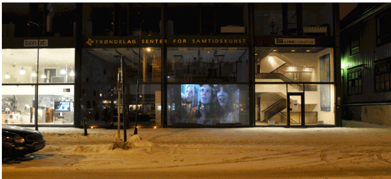
FOTO VISNING AV MONSTROUS LITTLE WOMEN

I 2010 har ulike formidlingstiltak som seminar og debatter, muliggjorts gjennom samarbeider og ekstern finansiering.