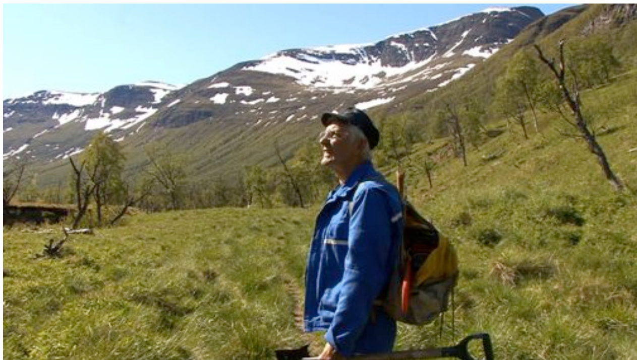
"Vuoigatvuodát eatnamiidda ja čáziide/ Retten til landet og vannet"

Med utgangspunkt i "Handlingsplan 2010/2011"